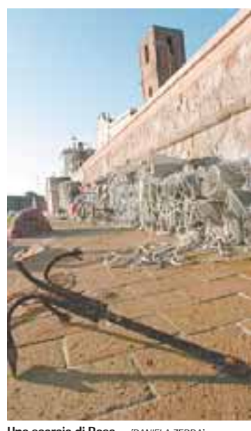
Uno scorcio di Bosa (DANIELA ZEDDA)